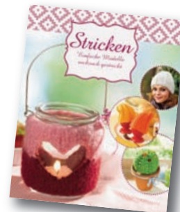
Einfache Modelle ruckzuck gestrickt