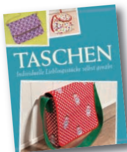
Mit Schnittmustern zum Download

http://www.naumann-goebel.de/naehen-stricken-haekeln.html