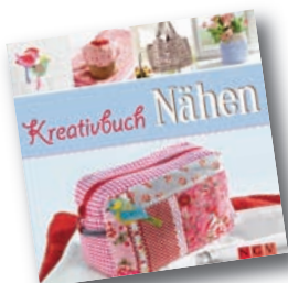
Mit Schnittmustern zum Download