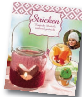
Einfache Modelle ruckzuck gestrickt