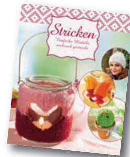
Einfache Modelle ruckzuck gestrickt