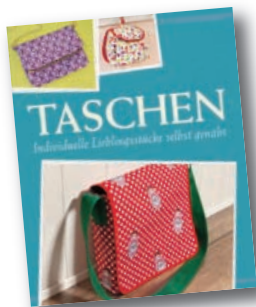
Mit Schnittmustern zum Download

http://www.naumann-goebel.de/naehen-stricken-haekeln.html