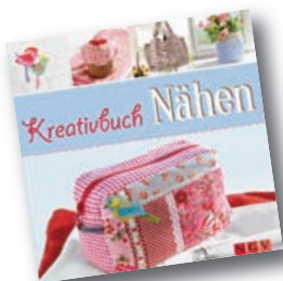
Mit Schnittmustern zum Download