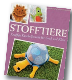
Mit Schnittmustern zum Download