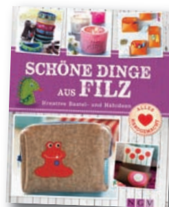
Mit Schnittmustern zum Download