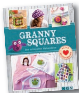
Die schönsten Häkelideen