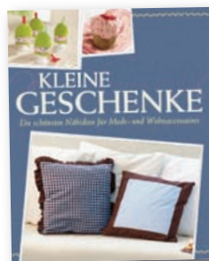
Mit Schnittmustern zum Download