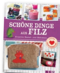
Mit Schnittmustern zum Download