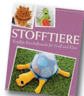
Mit Schnittmustern zum Download